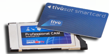
2 x tivùsat smartcard inclusa