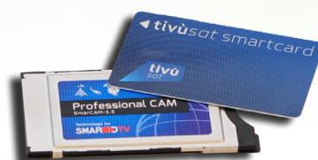
2 x tivùsat smartcard include