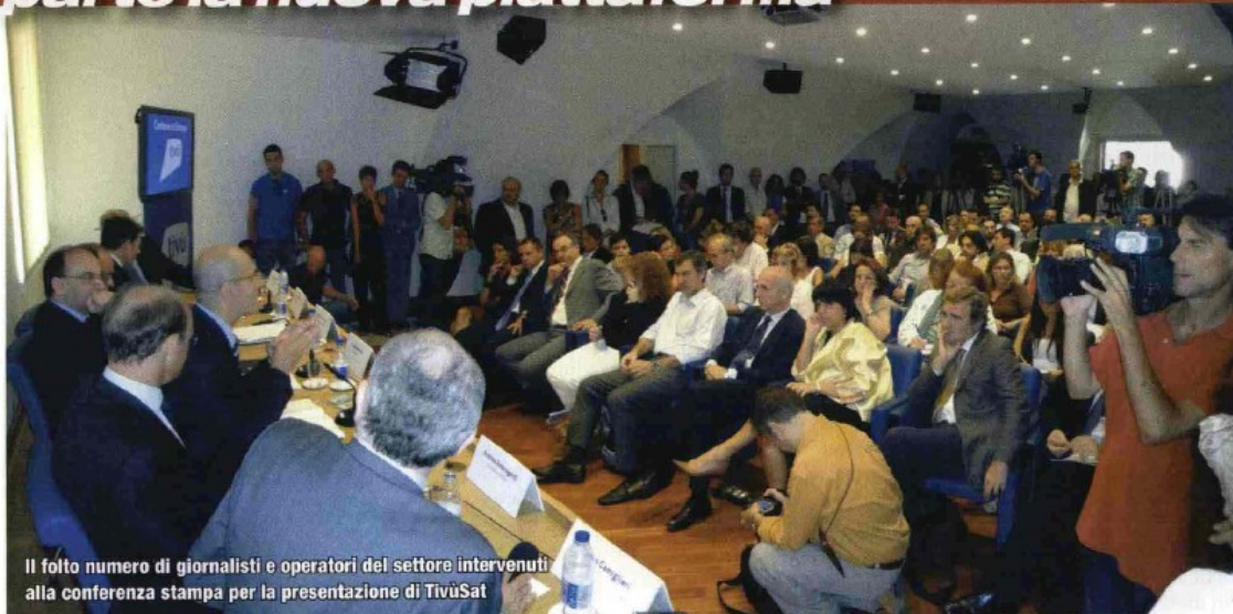
Il folto numero di giornalisti e operatori del settore intervenuti alla conferenza stampa per la presentazione di TivùSat