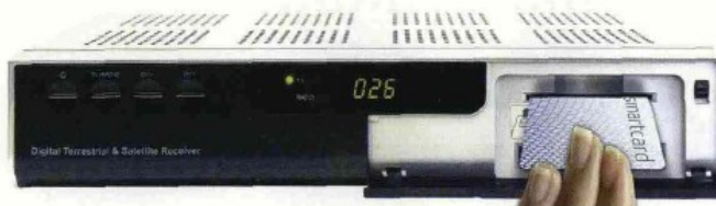
L'inserimento della smart card all'interno del nuovo modello di decoder TivùSat Humax Combo-9000