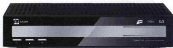
Il decoder TeleSystem 9000