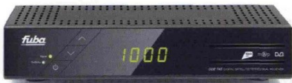
Il decoder Fuba/TeleSystem Ode 745

Analogamente ad Ambrogetti e Balestrieri, anche Giancarlo Leone, vicedirettore generale RAI, ha cercato di convincere i giornalisti (non sappiamo fino a che punto...) che TivùSat nasce solo come ambiente di supporto alla diffusione DTT nazionale in zone di ricezione terrestre problematica, e non come strumento di battaglia tattica nei riguardi di SKY. Un'identica opera di convincimento ha cercato di compiere anche Marco Giordani, AD di RTI/Mediaset, quando ha spiegato che la partecipazione di tutti i canali free del Biscione all'interno del bouquet TivùSat non vuole perseguire alcun obiettivo strategico,