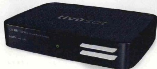
Il set-top-bpx ADB i-Can 1110HS