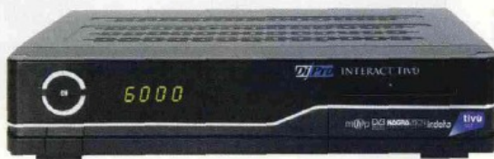
Il decoder Auriga DiPro Interact Tivù